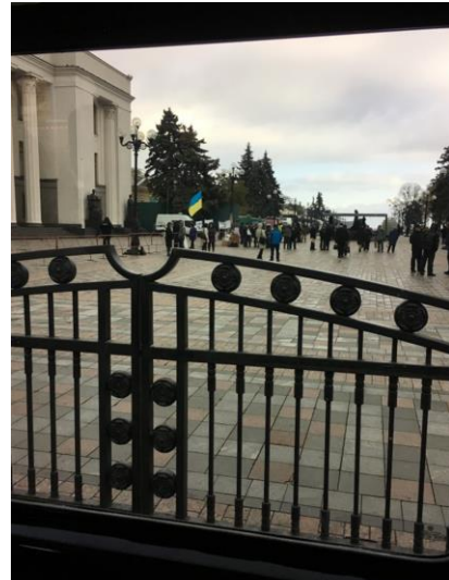
Dagelijks zijn er demonstraties rond het parlement in Kiev. Er is geen neutrale zone.