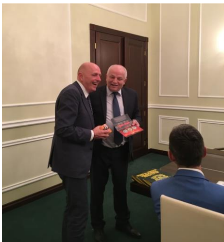
Georges Dallemagne wisselt een aandenken uit met Stepan Kubiv, de Eerste vicepremier van Oekraïne.

Stepan Kubiv is als Eerste vicepremier bevoegd voor economische ontwikkeling en handel. Hij zag vooral de digitale economie en de agro-industrie als terreinen voor samenwerking met de Europese Unie. Ondertussen stelt hij dat de Oekraïense economie is gestabiliseerd. Hij verwacht zelfs een groei met 3%. Kubiv merkte ook op dat de Europese Unie zelf minder stabiel is geworden door de terreurdreiging en de Brexit.