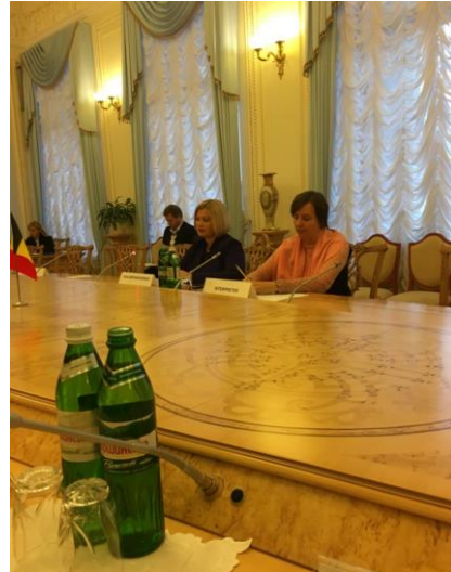
Iryna Geraschenko, Eerste ondervoorzitter van het Oekraïense parlement, is ontgoocheld in de houding van het westen tegenover de grote Russische buur.

De Eerste ondervoorzitter van het parlement Iryna Geraschenko betreurde de slinkende steun voor Oekraïne in wat zij als een echte oorlog met Rusland bestempelt. Daarom protesteerde ze tegen de organisatie van een Assemblee van de Interparlementaire Unie (IPU) in Sint-Petersburg in 2017. “Er zullen daar parlementsleden zijn uit de illegaal bezette Krim. Door naar Sint-Petersburg te gaan, erken je hen.” Bovendien stelde ze aan de kaak dat Rusland humanitaire opdrachten zoals van het Internationale Rode Kruis in de Donbas verhindert. Tegelijk trekt Rusland zich niets aan van de grens tussen beide landen. De gewezen ambassadeur bij de Europese Unie, Boris Tarasiuk, was nog scherper voor de positie van de westerse landen in de IPU. De Belgische delegatie ondersteunde echter dat België Oekraïne wel degelijk gesteund heeft in de 12-Plusgroep en dat ons land daarna een negatieve stemming over Oekraïne heeft willen vermijden. Het negatieve resultaat van het Nederlandse referendum over het NAVO-associatieverdrag met Oekraïne was volgens de Belgische delegatie niet gericht tegen Oekraïne, maar tegen de Nederlandse politiek. Een sfeer van pessimisme en populisme heeft het resultaat sterk beïnvloed. Gelukkig zoekt de Nederlandse premier Rutte met de parlementaire oppositie naar een uitweg.