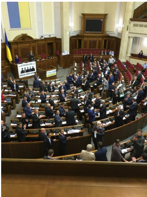
De Belgische delegatie krijgt applaus op de banken van het Oekraïense parlement.

De 1,5 miljoen Oekraïners die gevlucht zijn naar andere delen van het land na de bezetting van de Krim en de Donbas, hebben huisvestingsproblemen. Een NGO die beleidsvoorstellen doet over woonsubsidies en lage renteleningen, hoopt dat haar pilootprojecten door de overheid worden overgenomen. Deze NGO klaagde ook aan dat de media onvoldoende communiceren over voordelige overheidsmaatregelen, zoals de belasting-restitutie, wanneer een bedrijf IDP's tewerk stelt. De Belgische delegatie raadde de NGO aan samen te werken met de internationale hulporganisaties die al voet aan wal hebben in Kiev.