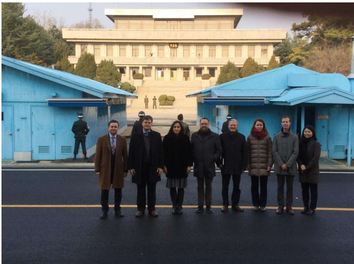
De delegatie op de grens met Noord-Korea

Na de briefing bracht de delegatie een bezoek aan enkele observatieposten waar toelichting werd gegeven bij een aantal aanvallen van Noord-Koreaanse militairen die zich in de loop der jaren hebben voorgedaan. Daarnaast werd ook een ondergrondse tunnel bezocht die door Noord-Korea in het geheim werd aangelegd na de oorlog en die bij toeval werd ontdekt. De (aldus vrijdelde) bedoeling was om de tunnel door te trekken tot aan de hoofdstad Seoel en aldus duizenden militairen in een verrassingsaanval in te zetten en Seoel te overrompelen.