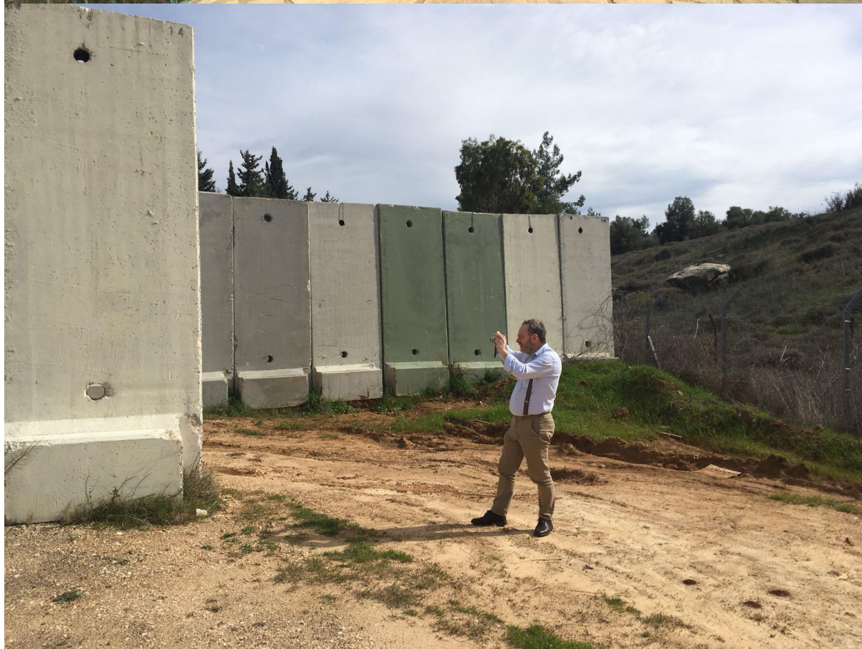
Grens met Libanon